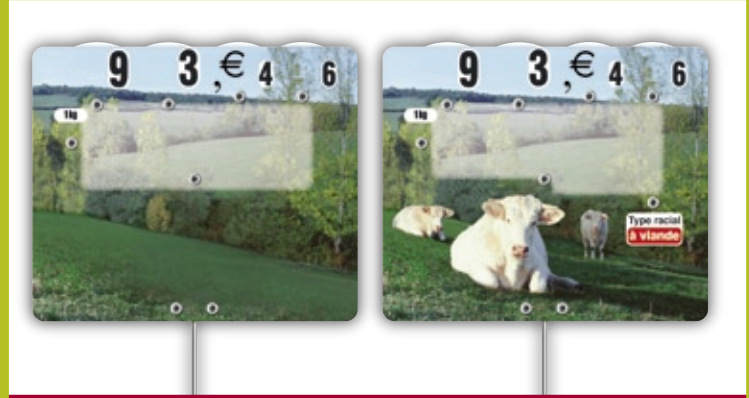
PRAIRIE (5 modèles)